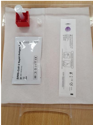
fertig gerichtetes Ablagefach!

4 Teile auf gerichtetem Schüler-Ablagefach: